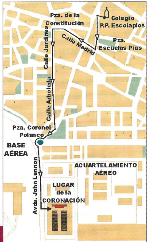
Colegio P.P. Escolapios-Lugar de la Coronación