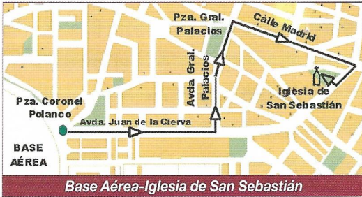
Base Aérea-Iglesia de San Sebastián