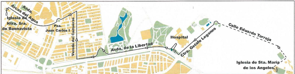
Iglesia Santa María de los Ángeles-Iglesia Nuestra Señora de Buenavista