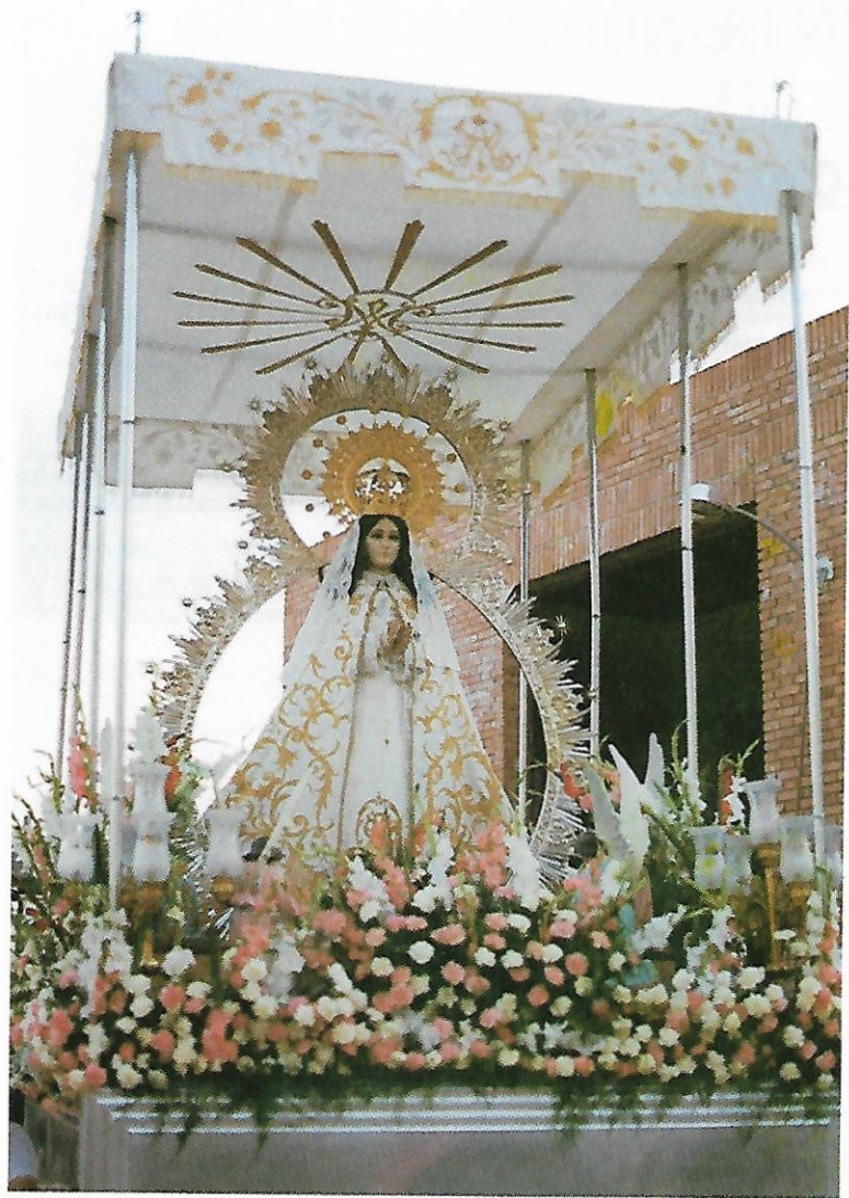
Nta. Sra. de Los Angeles Ciudad Real