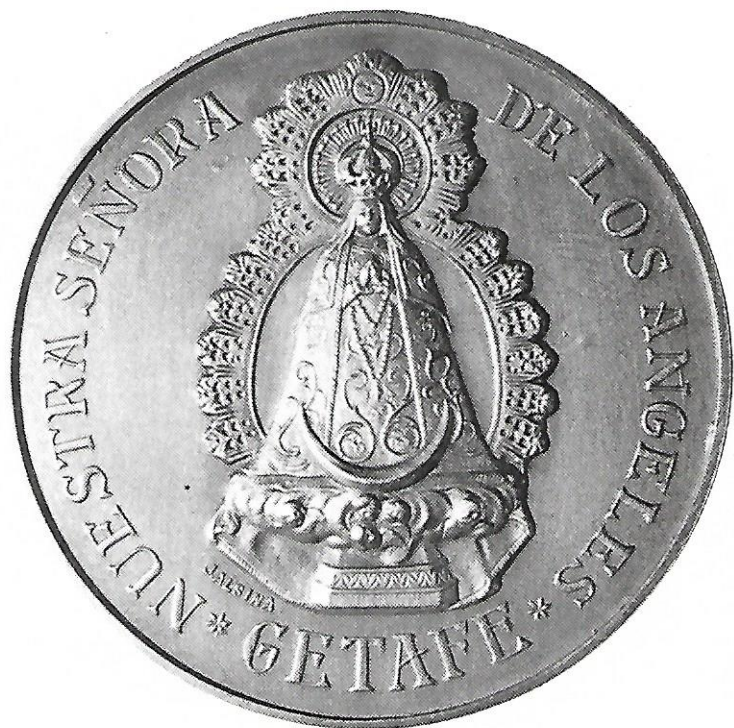
Medalla del siglo XIX

La Virgen de los Angeles sea lazo de unión espiritual entre los vecinos de Getafe.