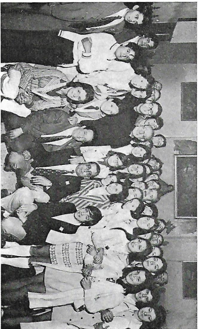
La juventud también tiene su sitio en la Congregación. Adolescentes de ambos sexos que renovaron su amor a María en 1972 al pasar a la sección de adultos.