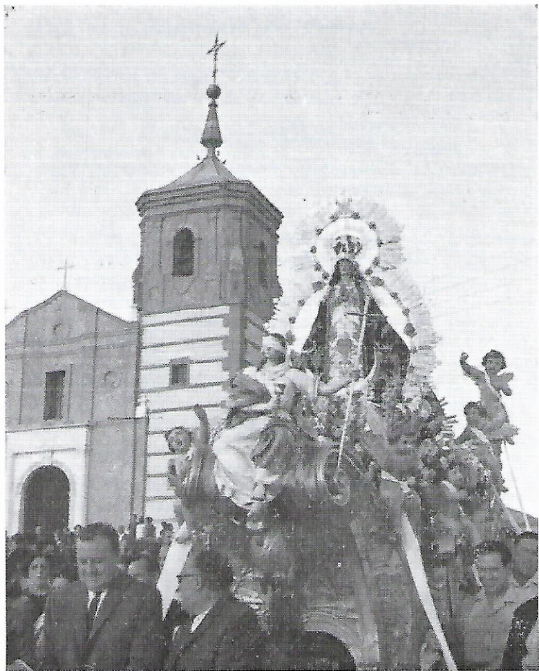
(La Virgen saliendo de la Ermita del Cerro)

Con la Ascensión del Señor, viene a Getafe. En Pentecostés, Getafe la aclama. Con la Santísima Trinidad, la Virgen vuelve a su Cerro.