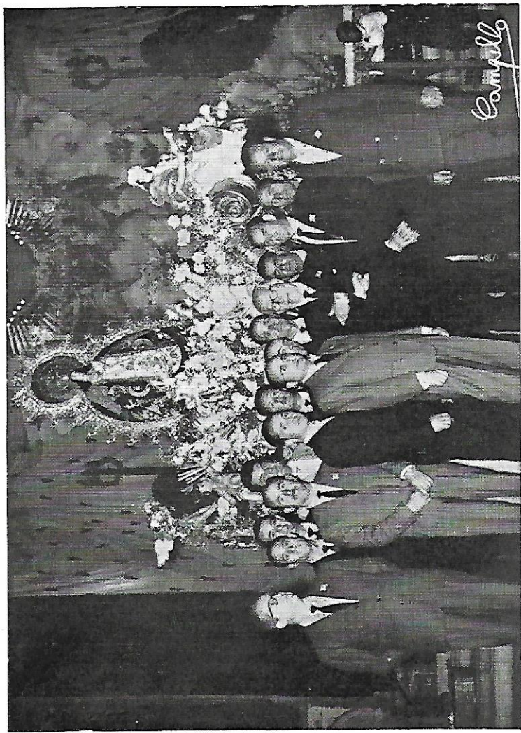
Los Mayordomos de 1963, después de terminada la Procesión del Domingo de Pentecostés.